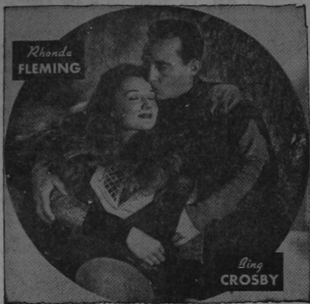
Estos dos enamorados están como se encuentran ahora los de la Junta de Gobierno: en un dulce sopor. ¡Dichosotes!